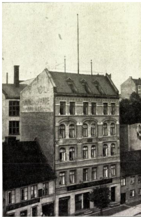
Østre samfunds nuværende lokale, Grønlandsleret.