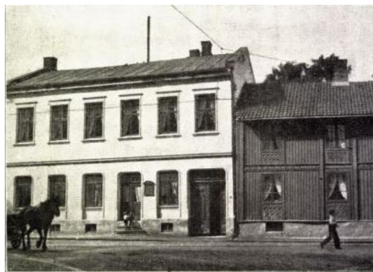
Østre Arbeidersamfunds første lokale. Enebakveien 16.

[15] Det var smaat bevendt med folkeforlystelser til langt utover mot syttiaarene. Man hadde liremænd og andre musikanter i gaardene ofte i forbindelse med abekatter, bjørne og jøglere, og omtrent de eneste steder, hvor arbeiderne kunde samles til nogen selskapelighet, var dansebulerne. Her artet livet sig temmelig raat og letsindig. Vistnok besøkte arbeiderne de cirkusser, som av og til gjestet Kristiania, men den egentlige arbeiderstand, haandverkerne ikke inbefattet, fandt sjelden veien til byens to teatre. De manglet de fornødne forutsætninger til at kunne opfatte og nyte komedie og fandt vel ogsaa at de ikke passet blandt beaumontens teaterpublikum. Man maa huske paa, at en almindelig kropsarbeider i de tider av mellem- og overklassen ikke agtedes for noget, men var stængt ute paa mange hold. Almueskoleundervisningen stod endnu paa et lavt trin, ingen offentlige biblioteker stod til den store masses raadighet, arbeiderne læste litet, deres litteratur var væsentlig morder- og kjærlighetsviser og kristelige skrifter, hvilket just ikke skulde bidra til at hæve nivaæet. Den nyere norske skjønslitteratur var stængt for dem.