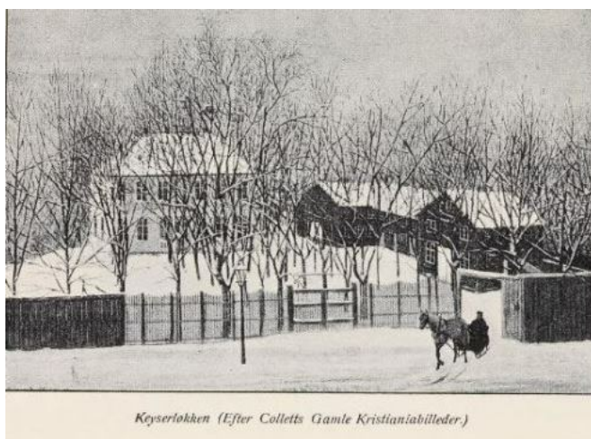
Keyserløkken (Efter Colletts Gamle Kristianiabilleder.)

Mine tidlige barndomsminde er knyttet til denne gamle løkke.