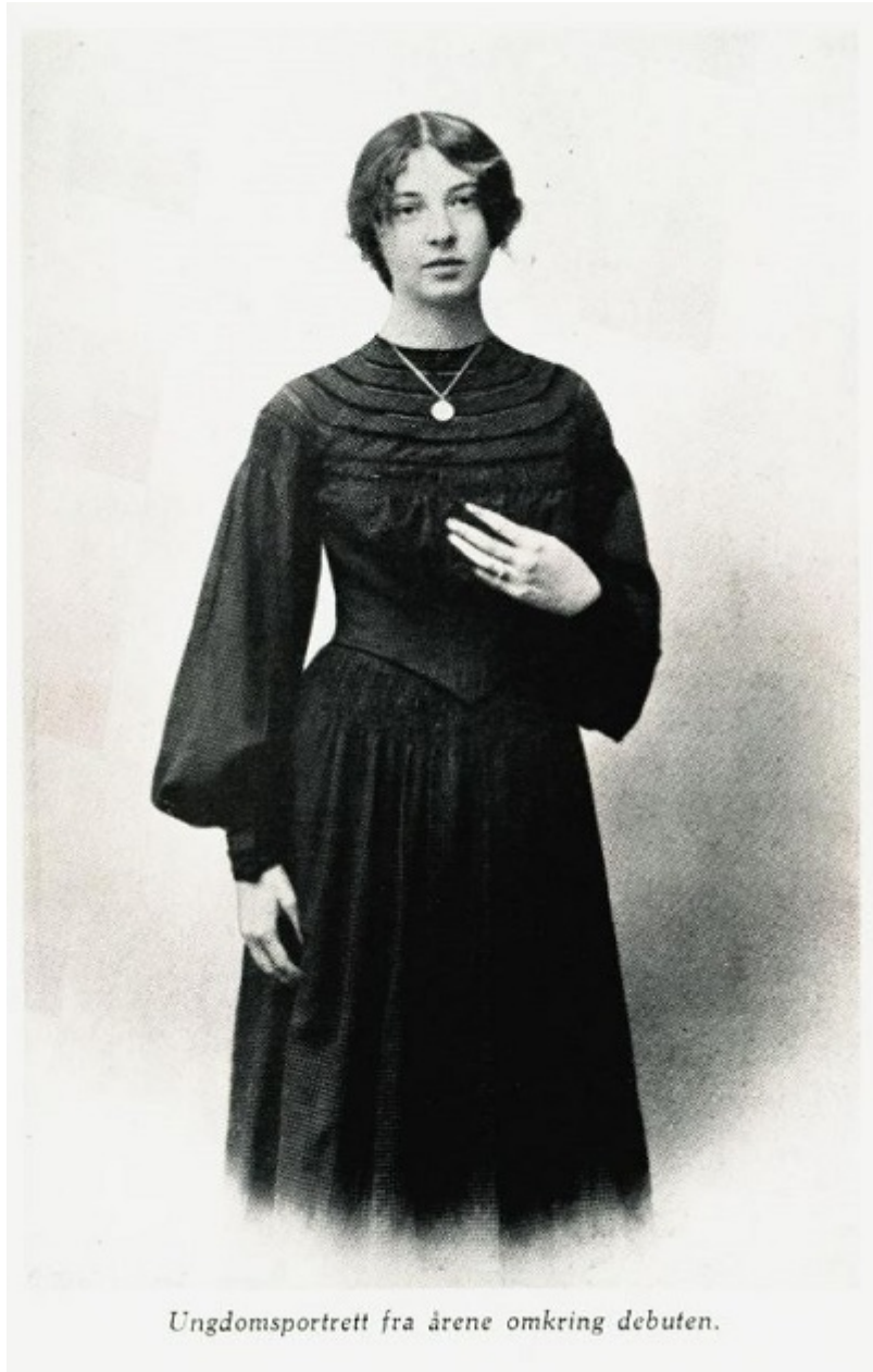
Ungdomsportrett fra årene omkring debuten.