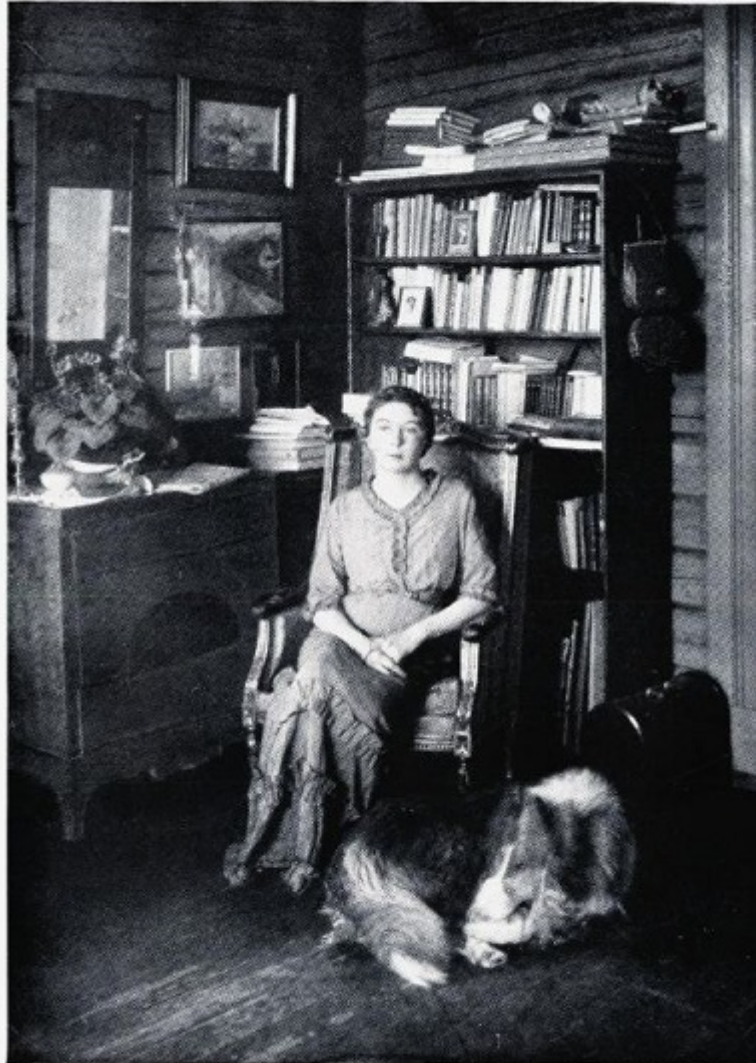
Fra ekteskapets første år, 1913.