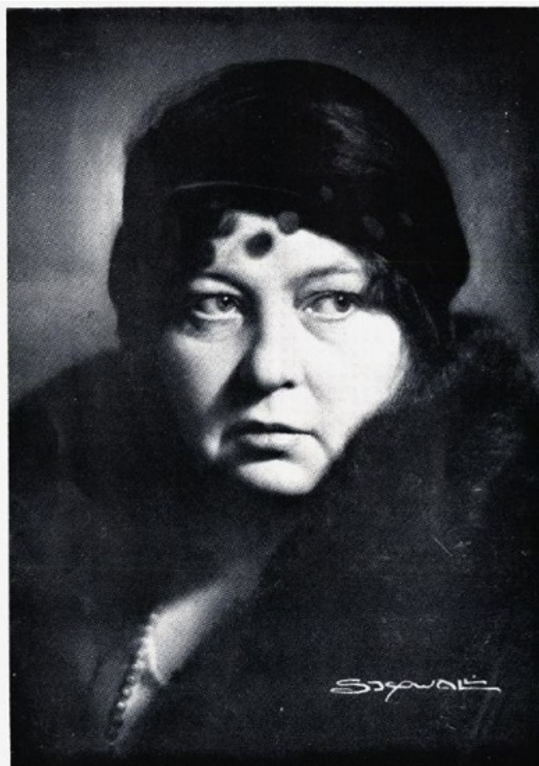
Sigrid Undset 1932.