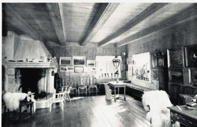
Felsetuen på Bierkebæk.