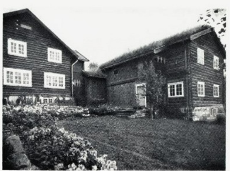
Bjerkebæk sett fra hagen.