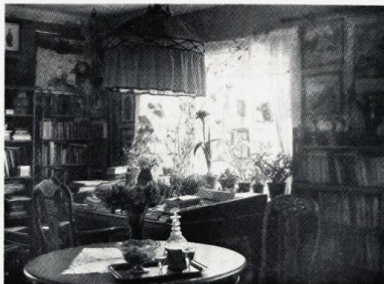
Arbeidsværelset på Bjerkebæk.

I denne tiden vokser minnet om de tre årene på Sinsen frem i henne og avklarer sig – hun kjenner det som har hun levd bak en piggrådsperring, og det begynner å demre for henne at til gjerningen som mor for tre stebarn og husholderske for en så stor familie kan hun kanskje ikke forsvare å vende tilbake. Hun står hele tiden i nær forbindelse med Svarstads barn, syr til dem, sørger for dem – men oftere og oftere kommer det for henne at hun er stillet foran et valg: egne barn og diktningen, eller selvopgivelse. Som hennes natur er voldte tanken henne idelige anfektelser og pine – hun hadde gått inn for å «klare det», og det er bittert for